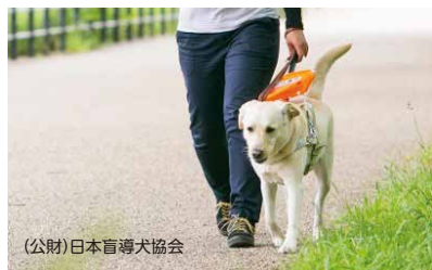
(公財)日本盲導犬協会